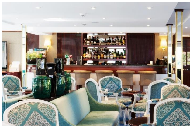
Salon - Bar