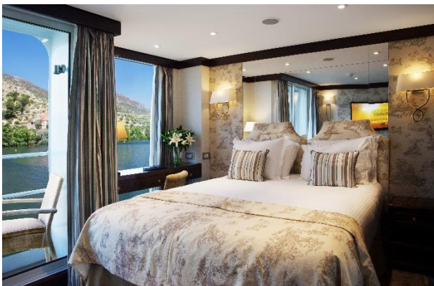
Cabine Deluxe Balcon pont Panorama

Les 59 cabines du bateau sont toutes extérieures et réparties sur 3 ponts. Au pont Principal, les 16 cabines Confort ont une superficie de 15 m 2 et sont équipées d'une fenêtre haute (qui ne s'ouvre pas). Le pont Supérieur dispose de 23 cabines Deluxe de 15 m 2 , avec large baie vitrée ouvrable. Au pont Panorama, 18 cabines Deluxe Balcon d'une superficie de 20 m 2 et 2 Junior Suite d'une superficie de 30 m 2 disposent d'un balcon privatif équipé d'une table et de fauteuils. Toutes les cabines sont équipées de 2 lits pouvant être rapprochés ou séparés, climatisation individuelle, télévision, sèche-cheveux, coffre-fort, salle de douche et WC. Les Junior Suite disposent d'un coin salon.