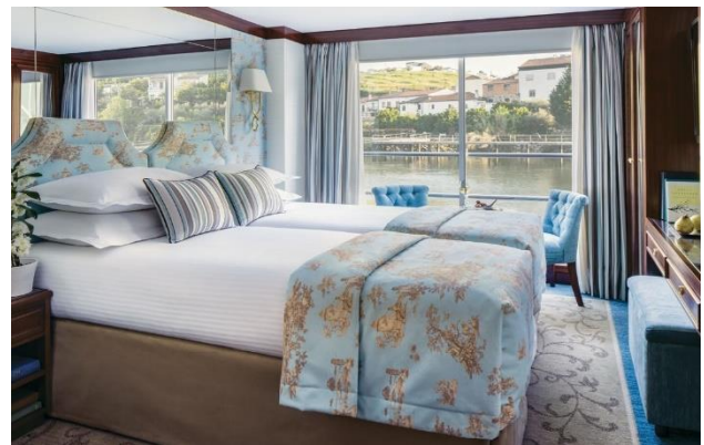
Cabine Deluxe Baie vitrée pont Supérieur